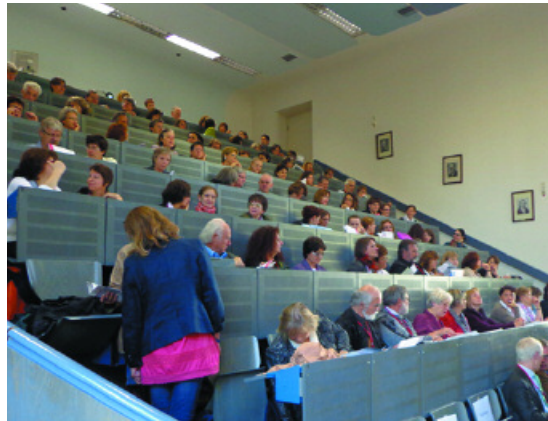
Nur wer rechtzeitig kam, konnte seinen Platz auswählen