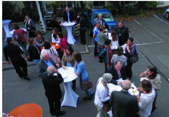
Prächtiges Wetter ermöglichte Pausen und Gedankenaustausch im Freien

Mit Interesse verfolge ich die Entwicklung der Arbeitsgruppe NFP Malteser Werke in Deutschland. Bei allen Verdiensten in der Förderung von NFP stelle ich