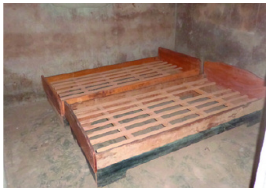
Da fehlt noch Einiges!