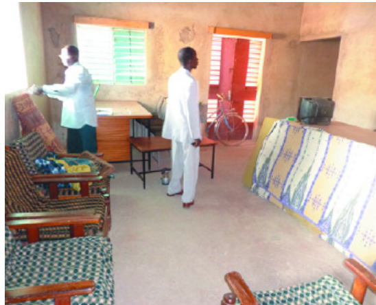
Am neuen Ort ist der Empfang bald eingerichtet