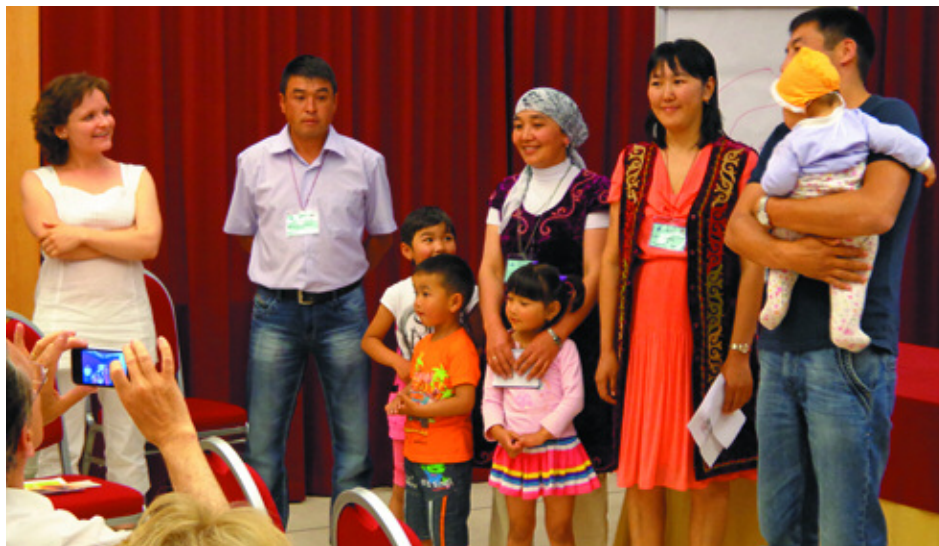
Ein fröhliches und farbenprächtiges Bild: die Delegation aus Kirgistan, 2 Familien mit Kindern

dere i contributi finanziari dell'UE. Il giorno seguente i partecipanti si sono recati a Santa Maria Nascente per partecipare all'incontro con persone che insegnano metodi naturali, provenienti da tutto il mondo. Rappresentanti di Europa, Africa, Americhe ed Asia hanno potuto dare un'idea delle attività nel loro paese. Al pomeriggio la parte statutaria, con l'assemblea: due nuove organizzazioni sono state accolte, provenienti dal Kirgistan e dalla Lettonia. Purtroppo non è arrivato nessun delegato di Avifa, ed il loro dossier è stato presentato solo in francese, cosicché non è stato possibile accettare questa organizzazione. Le elezioni del comitato sono state posticipate all'anno prossimo, per mancanza di candidati. La prossima occasione di incontro sarà a Roma, dal 4 al 6 ottobre 2013. Alla domenica mattina i partecipanti hanno potuto presenziare alla Santa Messa con Benedetto XVI.