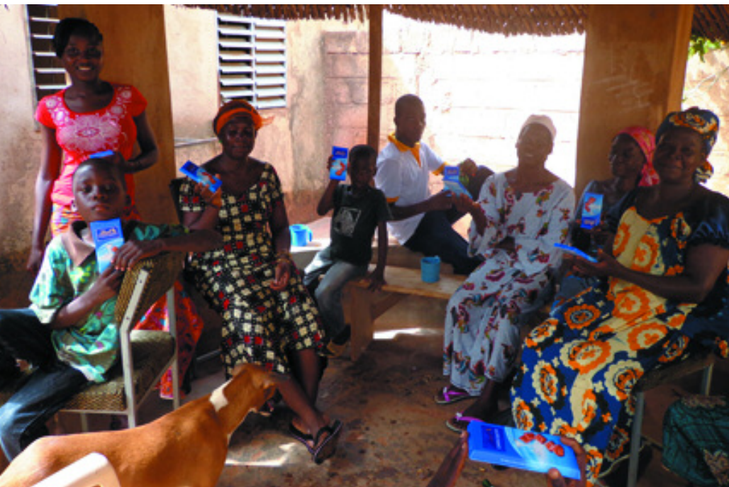
Die unterstützten Frauen und Waisenkinder freuen sich an der Schokolade aus der Schweiz

rer une grossesse. L'enfant qui se développe dans le sein de sa mère est alors considéré comme un être humain avec toutes les capacités de développement qu'il possède.